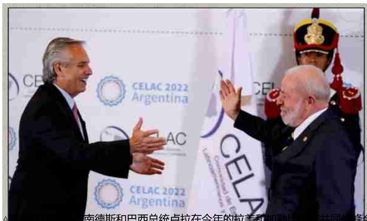
▲阿根廷总统费尔南德斯和巴西总统卢拉在今年的拉美和加勒比国家共同体峰会上会面

从图中可以看出，自2017年美国前总统特朗普发动贸易战后，全球美元储备占比就开始快速下降：