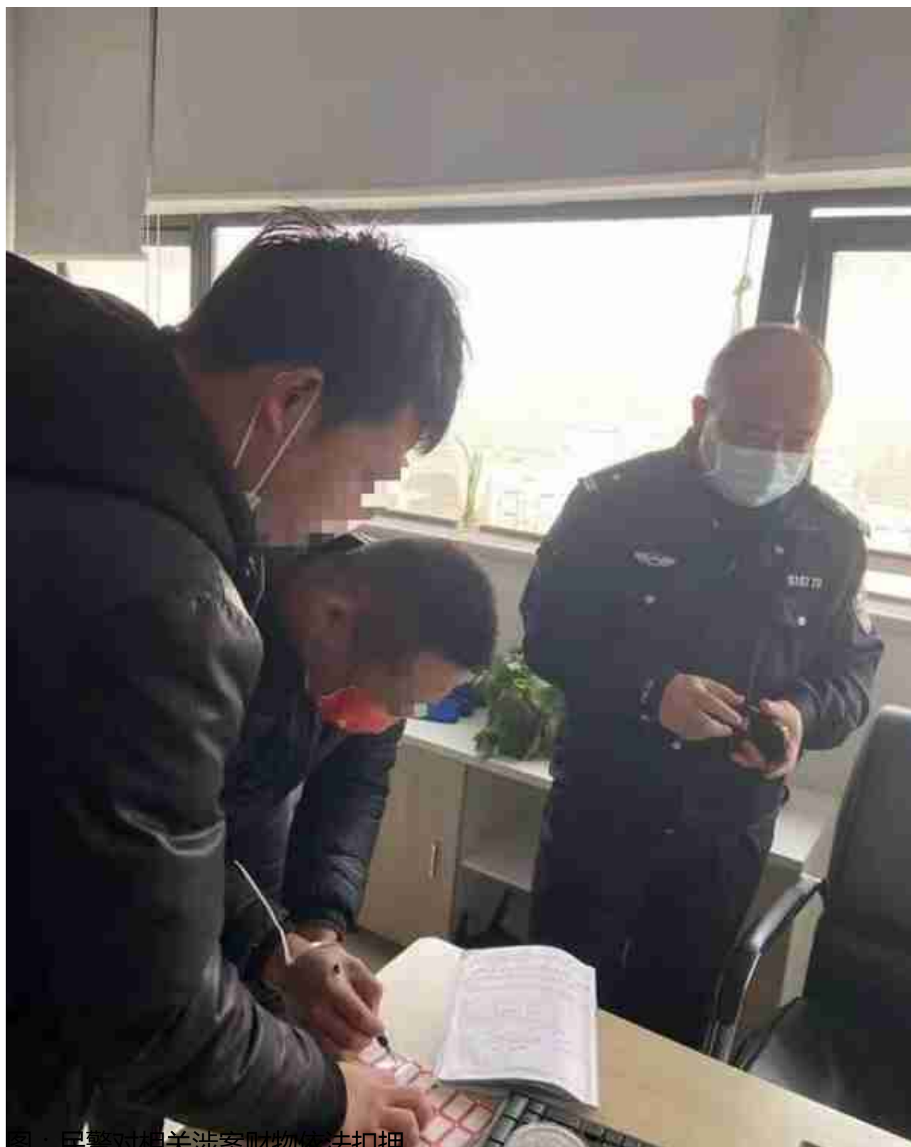
图：民警对相关涉案财物依法扣押